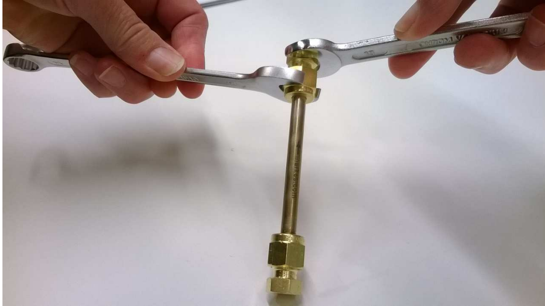
Kuva 1 Sulikutulppien avaaminen ja sulkeminen jakoavaimilla