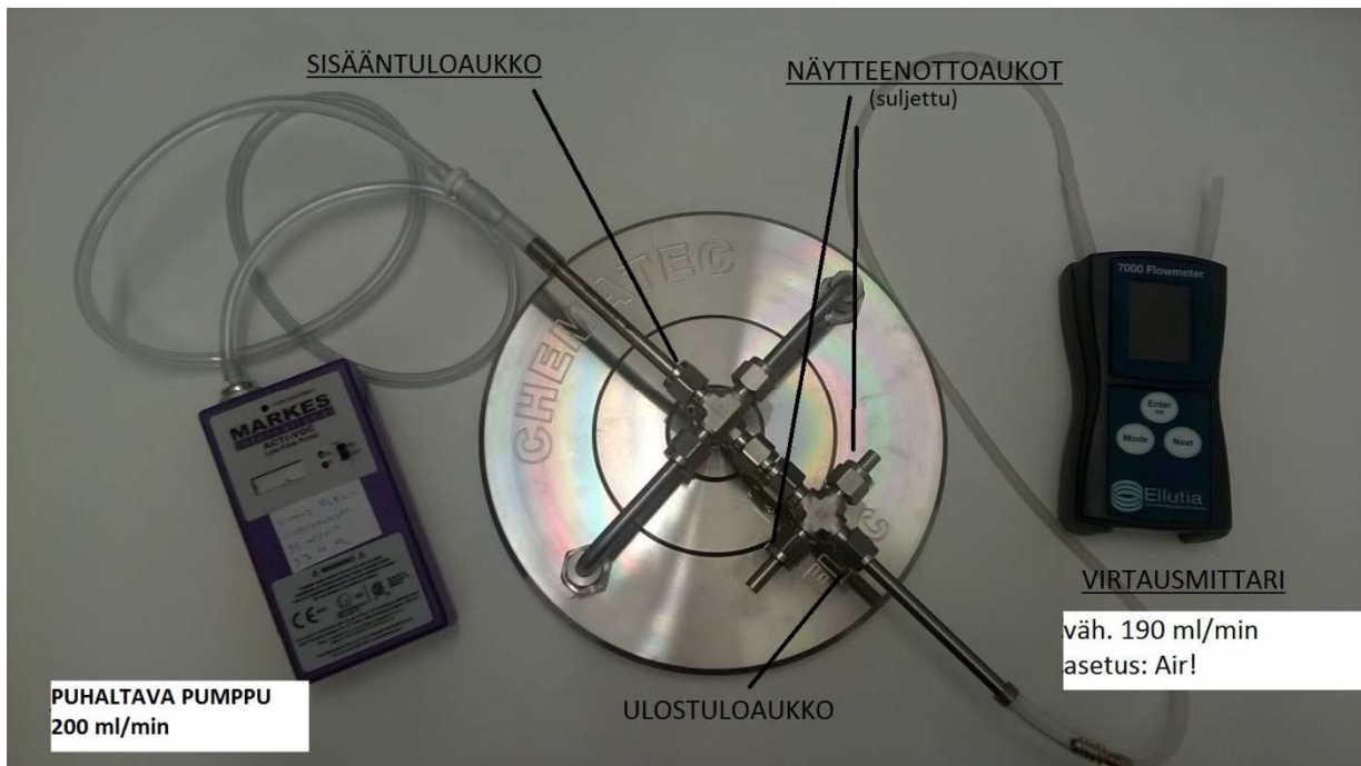
Kuva 1. Kuvun huuhtelu (vaihe 1) ja tuuletus (vaihe 2)