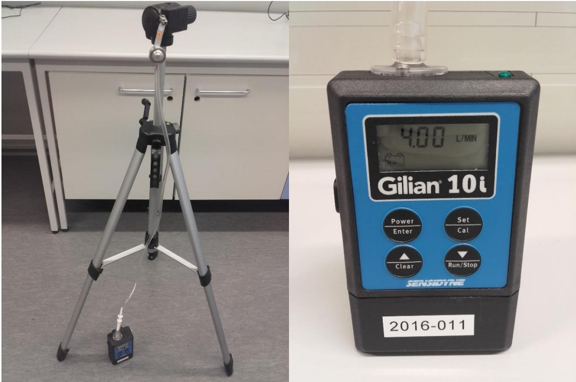
Kuva 1. Esimerkki näytteenottoasetelmasta Kuva 2. Pumpun painikkeet ja näyttö