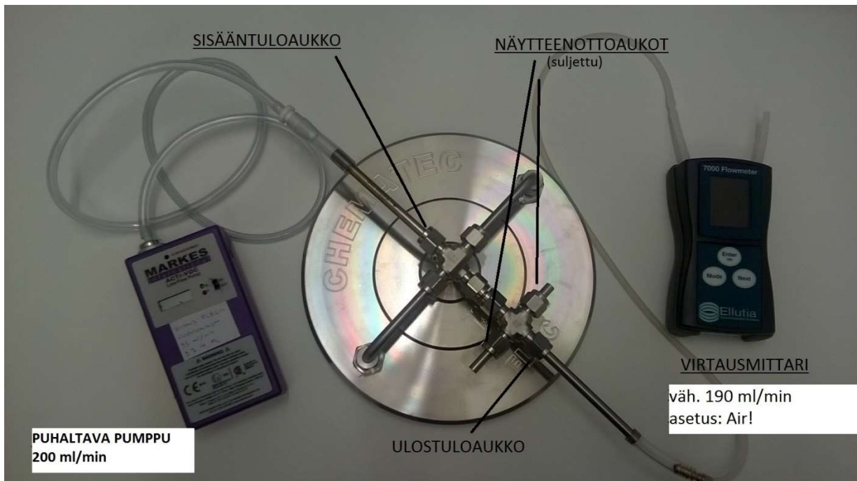
Kuva 1. Kuvun huuhtelu (vaihe 1) ja tuuletus (vaihe 2)