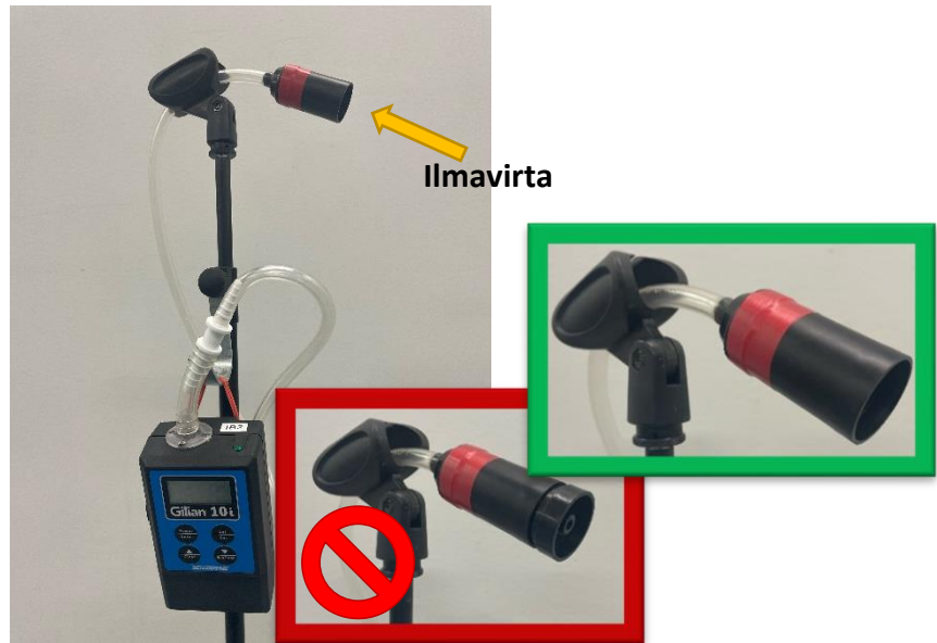
Kuva 2. Gilian-pumppu ja musta suodatin. Irrota koko inlet-kappale.