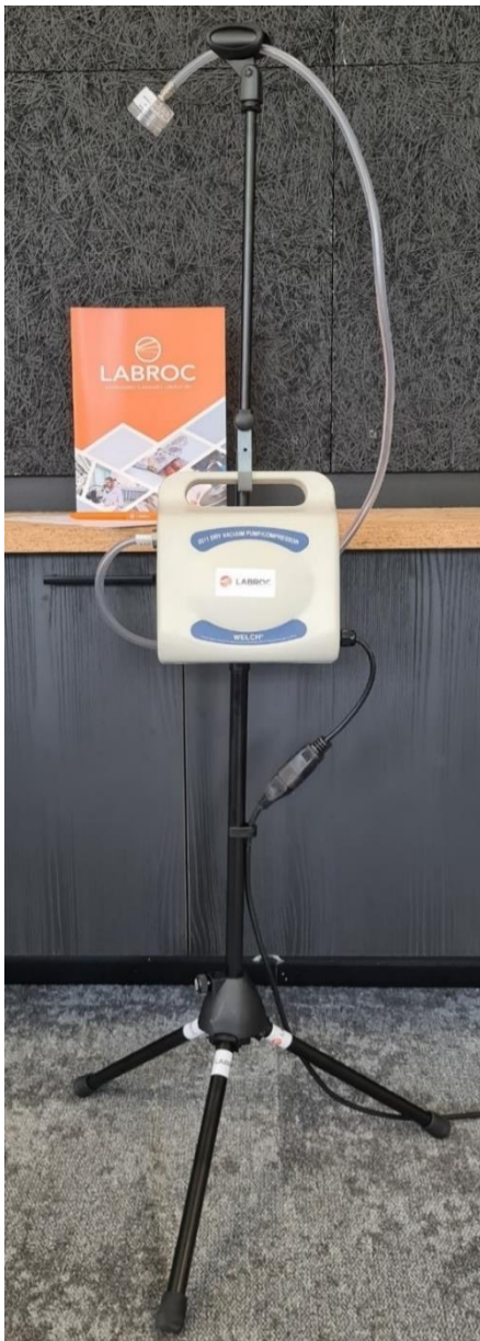
Kuva 1. Näytteenottolaitteisto koottuna.